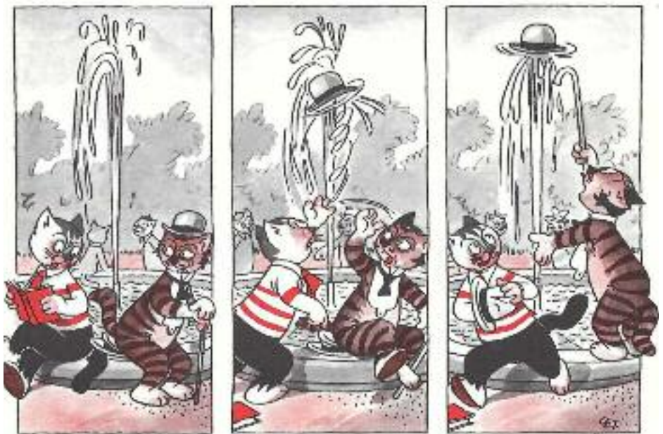
'Duelo de sombreros'