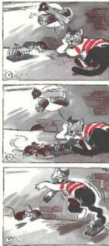
'1:0 para los ratones'