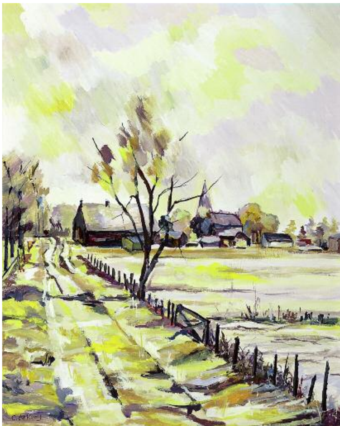
Coen de Rooij (Miembro Asociado/Países Bajos), 'Vista de un pueblo en otoño', acrílico, 50x40 cm.